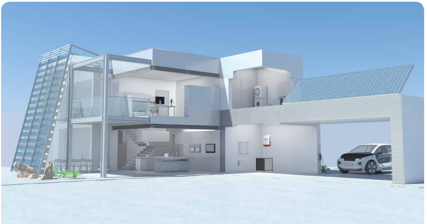
DIAGRAMMA DELLA CONFIGURAZIONE DEL FRONIUS ENERGY PACKAGE